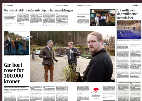
Oppslag i Lindesnes avis, julaften 2020

I samarbeid med Aurebekk gartneri ga Mandalsfondet en gave på 100.000 kroner som gikk til privatpersoner og andre som fikk gratis roser.