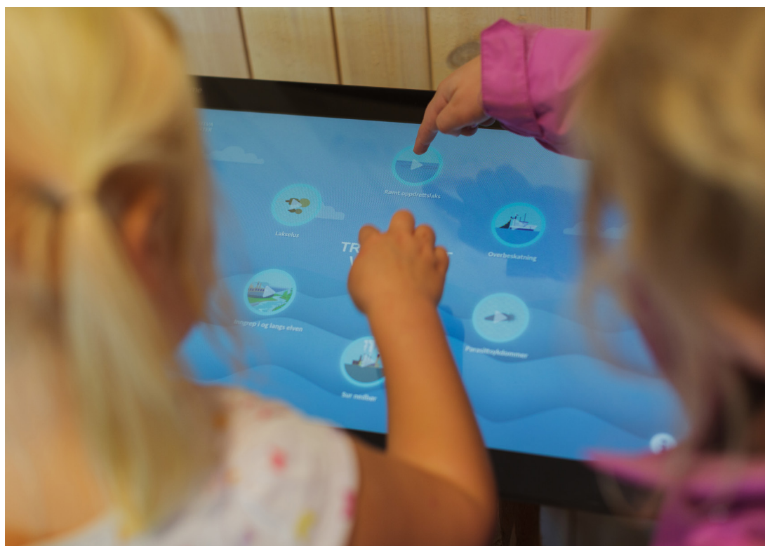
Mandalselva Villakssenter fikk støtte fra Anders Sveaas' og Hustru Granvilde F. Knudsen Mandalsfond til prosjekter i utstillingsområdet.